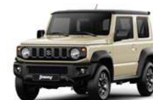
Marfil techo negro