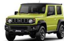
Verde lima techo negro