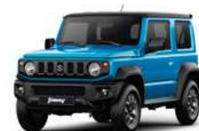
Azul techo negro